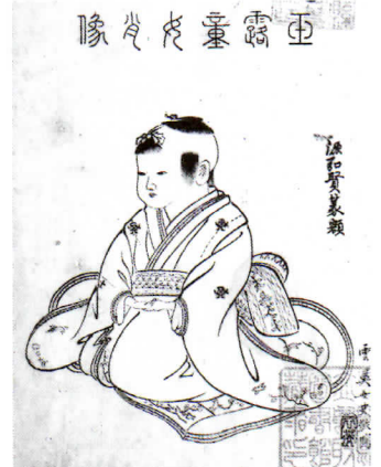
玉露童女（露姫）肖像