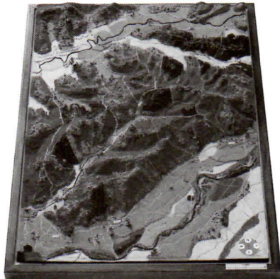
ゆかりの地ジオラマ