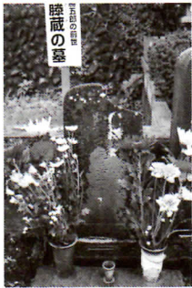
藤蔵の墓（高幡不動尊）