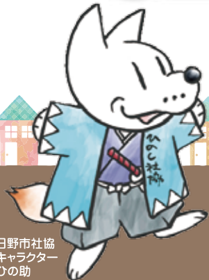
日野市社協 キャラクター ひの助

《例:介護職員、看護師、生活相談員ほか》履歴書は原則不要ですが、面接を希望する場合はご持参ください。