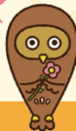
東京都福祉人材センターキャラクター フクシロウ